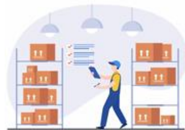
انبار تعدادی و ریالی