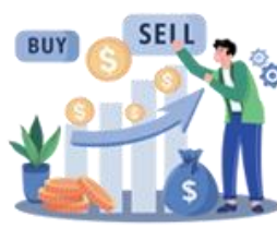
خرید و فروش