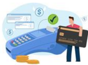
دریافت و پرداخت

نرم افزار بازرگانی تحت وب داده سامان با ارائه یک پکیج ماژولار، شامل ماژول های انبار، خرید و فروش، دریافت و پرداخت و دفتر کل، کلیه فرایندهای بازرگانی را پوشش خواهد داد.