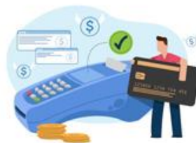
دریافت و پرداخت