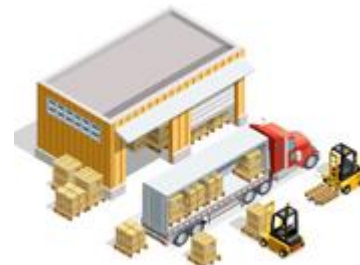
کنترل موجودی انبار سردخانه